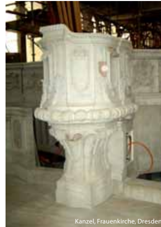
Kanzel, Frauenkirche, Dresden

Auszeichnung mit dem „Peter Parler Preis“ im Jahr 2003