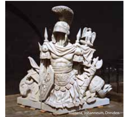
Militaria, Johanneum, Dresden