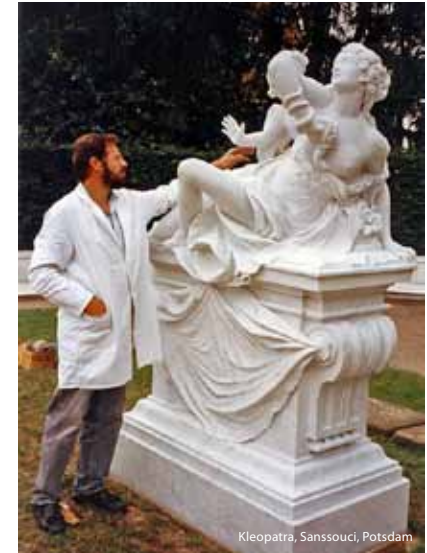
Kleopatra, Sanssouci, Potsdam